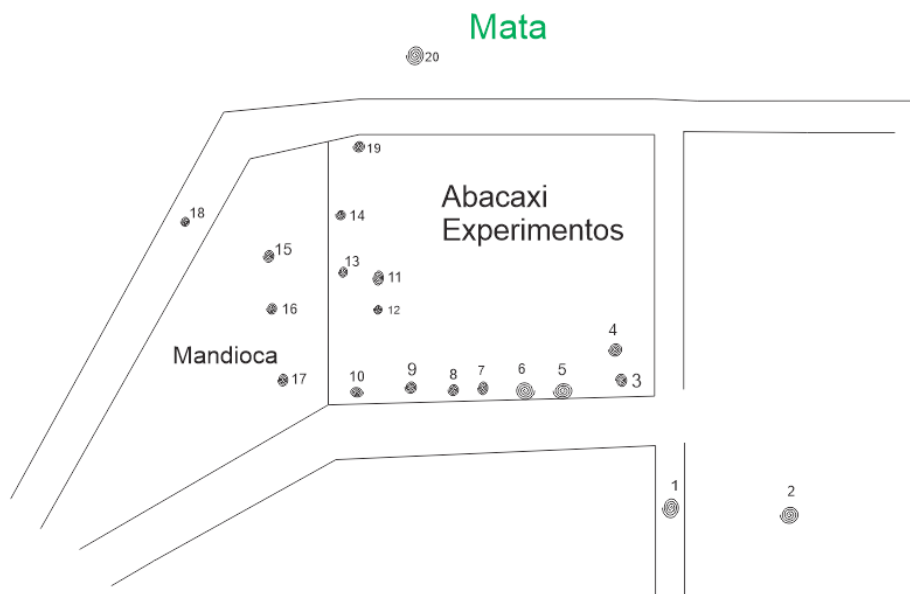
Figura 3. Croqui do experimento 1 (área do abacaxi), mostrando a distribuição dos ovelhos alimentados com o produto. Fazenda Ceral. Lençóis-BA. 2016.