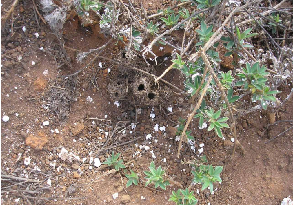
Figura 2. Aspecto geral de um olheiro da formiga boca-de-cisco, Acromyrmex balzani , mostrando resíduo do produto, aplicado em sachê. Fazenda Ceral. Lençóis-BA. 2016.