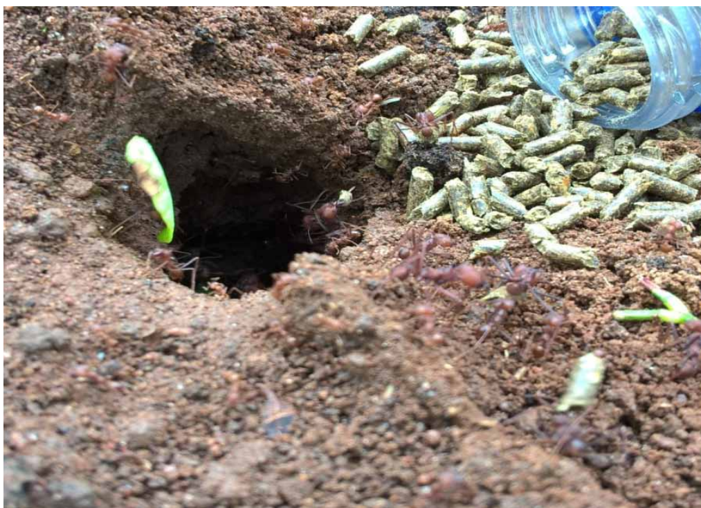
Figura 5. Aspecto geral do olheiro, mostrando o carregamento da isca pelas formigas, a partir do produto à base de Tephrosia candida colocado na garrafa pet. Fazenda Ceral. Lençóis-BA. 2016.