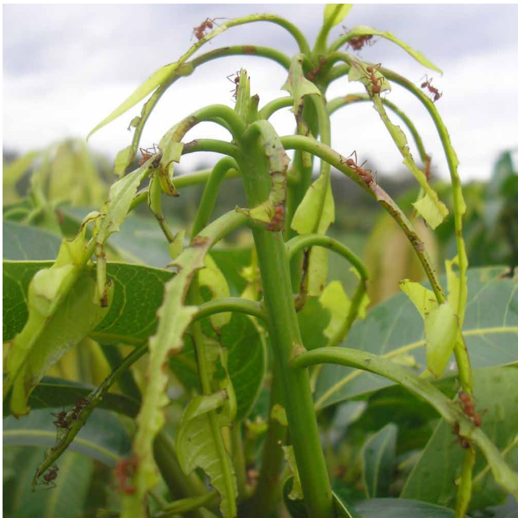
Figura 1. Dano causado pela formiga boca-de-cisco, Acromyrmex balzani , em ramo de mangueira, Mangifera indica . Fazenda Ceral, Lençóis-BA. 2016.