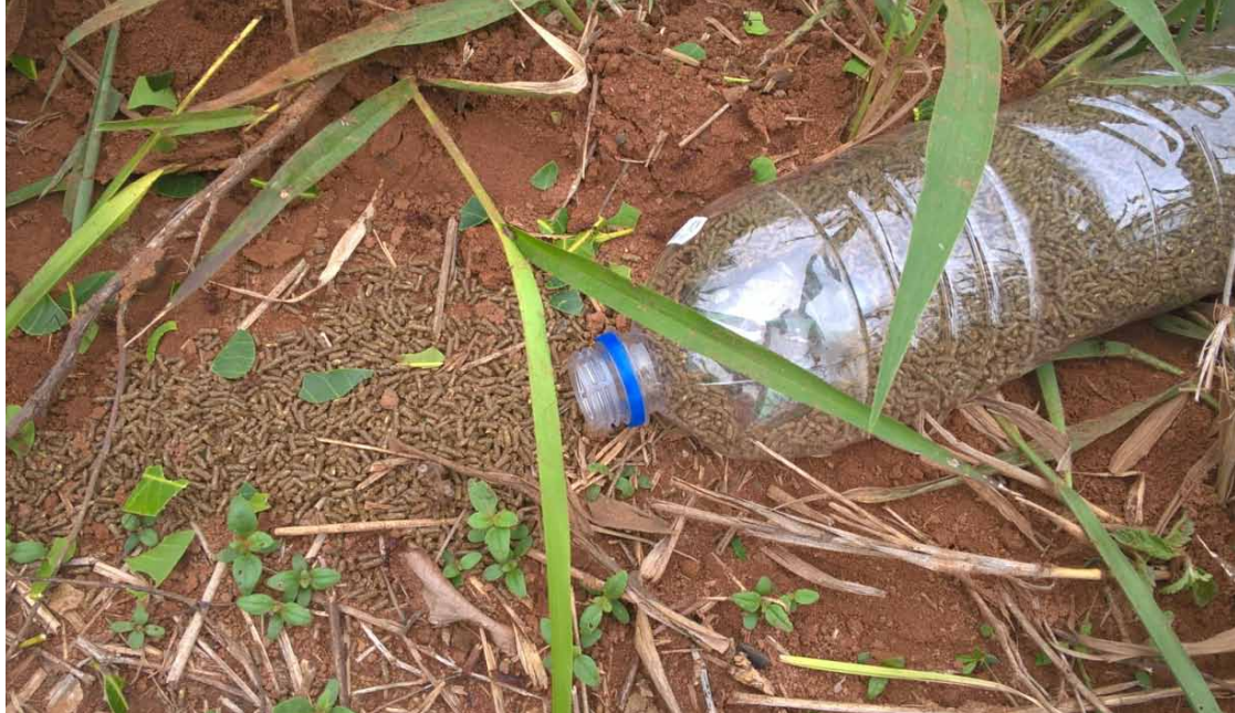
Figura 6. Vista geral da garrafa pet contendo o produto base de Tephrosia candida em seu interior, e a isca no solo junto ao olheiro. Fazenda Ceral. Lençóis-BA. 2016.